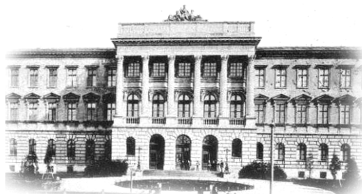
Головний корпус Львівської політехніки

Національний університет "Львівська політехніка" Колегія та профком студентів і аспірантів Рада молодих вчених